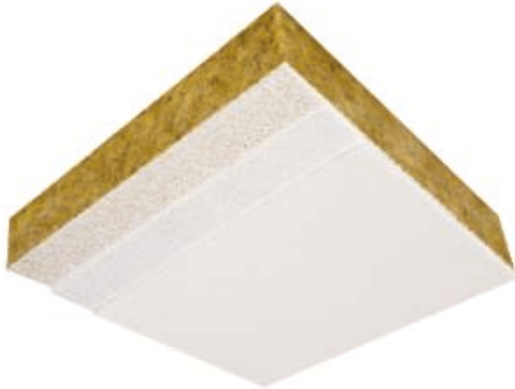
Abb. 1: Systemaufbau CapaCoustic Fine